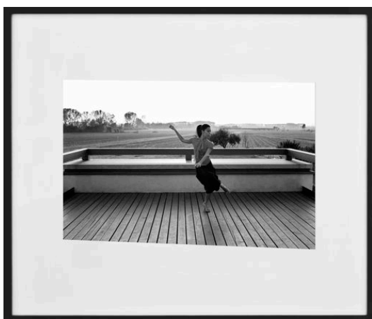
Spleen #2, Franz interpreted by Alessio, 2010 Courtoisie Studio Guenzani, Milan Courtoisie de l'artiste