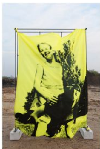
Sans titre , 2009 Impression digitale