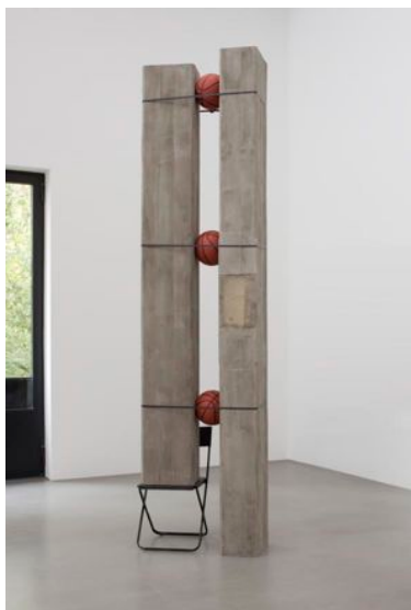
Untitled (Jumping Jack), 2009 75 x 330 x 40 cm Installation à Portikus, Francfort Courtoise des artistes