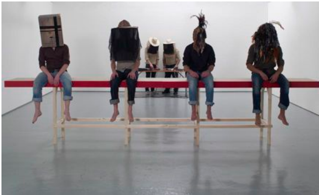
Chariot, Fool, Emperor, Force , 2009 Projection vidéo, son, banc en bois