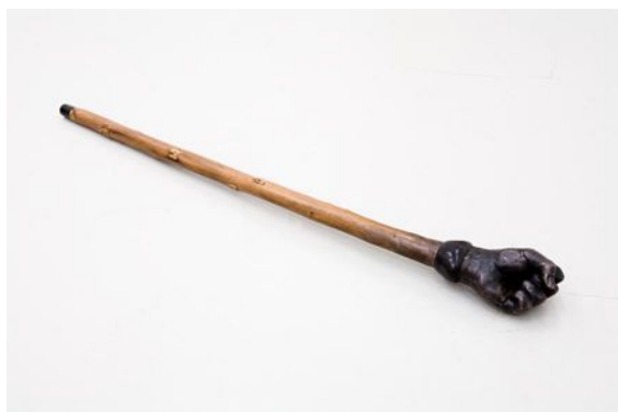
Bastone , 2009 Bronze, wood, bone/ 90 X 9 X 8 cm Courtoisie galerie Fluxia et de l'artiste