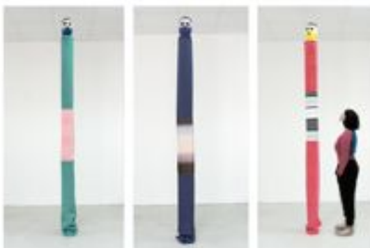
Three Wise Monkeys , 2010 3 parts cm 18 x 25 x