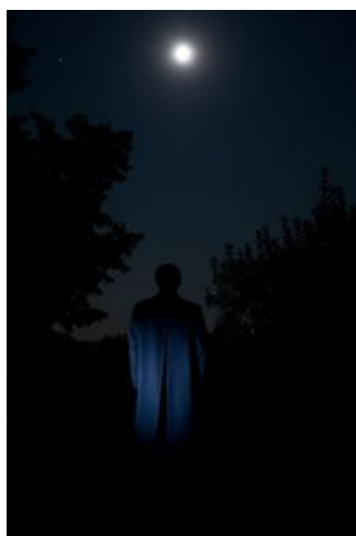
Autoritratto come parte di un paesaggio notturno (tra un triangolo e un cerchio) , 2009 Stampa Lambda. 26,5 X 40 cm. Courtoisie de l'artiste