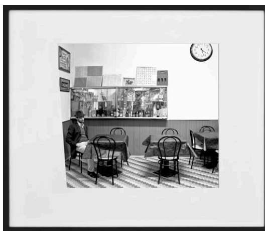
Spleen #1, Nana interpreted by Silvia, 2010 Courtoisie Studio Guenzani, Milan Courtoisie de l'artiste