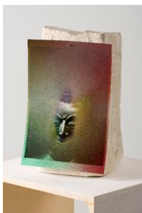
Untitled, 2010.