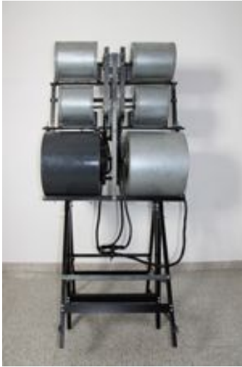
1320 rpm , 2009 Industrial squirrel cage fans, engines, iron bars, bolts, nuts, trestles. 90 x 90 x 170 cm